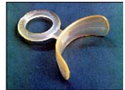
Munskärm används i viss träning

Tänk på att träning, för att ge bäst effekt, oftast ska utföras flera gånger i veckan under en tid.